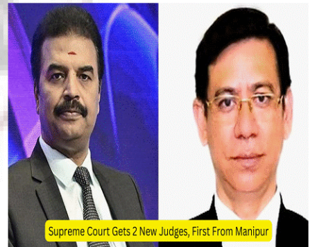
Supreme Court Gets 2 New Judges, First From Manipur