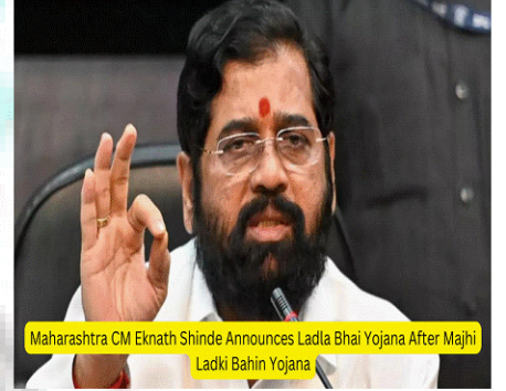
Maharashtra CM Eknath Shinde Announces Ladla Bhai Yojana After Majhi Ladki Bahin Yojana

(A) महाराष्ट्र के मुख्यमंत्री एकनाथ शिंदे ने पंढरपुर में युवाओं के लिए लड़का भाऊ नौकरी प्रशिक्षण और वजीफा योजना की घोषणा की। इससे पहले उन्होंने पात्र महिलाओं के लिए मासिक वित्तीय सहायता योजना शुरू की थी। योजना के तहत 12वीं कक्षा पास नौकरी चाहने वालों को 6,000 रुपये, डिप्लोमा धारकों को 8,000 रुपये और स्नातक डिग्री वालों को 10,000 रुपये प्रतिमाह मिलेंगे।